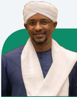
بقلم الإعلامي: الدكتور محمد عثمان

بعد ذلك نقوم لصلاة المغرب، فيقول لي: «يا