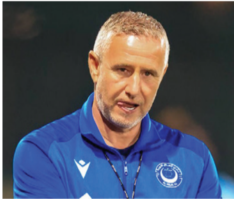
كيجالي - أكشن سبورت

علمت «أكشن سبورت» أن مجلس إدارة نادي الهلال اتخذ قراراً رسمياً بمنع المدرب الروماني ريجيكامب من الإدلاء بأي تصريحات صحفية خلال الفترة المقبلة، وذلك في أعقاب الجدل الواسع الذي أحدثته تصريحاته الأخيرة لوسائل الإعلام الرواندية، والتي أكد فيها رفضه خوض مباريات الدوري الرواندي عصراً خلال شهر رمضان. وجاءت هذه الخطوة بعد أن اعتبر المجلس أن المدرب تجاوز صلاحياته بإطلاق تصريحات دون الرجوع للإدارة، خاصة وأنها كادت تتسبب في أزمة مع رابطة الدوري والاتحاد الرواندي، في وقت يسعى فيه الهلال للحفاظ على استقراره الإداري والفني. ورغم امتثال ريجيكامب لقرار اللعب عصراً، إلا أنه لجأ إلى إراحة عشرة من عناصر التشكيل الأساسي في المباراة الأخيرة أمام موكورو، تحسباً للإرهاق قبل المواجهة المرتقبة أمام نهضة بركان المغربي في ربيع نهائي دوري أبطال أفريقيا منتصف مارس. غير أن هذه الخطوة تزامنت مع تعرض الهلال لأكبر هزيمة له في الدوري الرواندي هذا الموسم بخسارته من موكورو 3-1، ما أثار تساؤلات حول تأثير القرارات الفنية الأخيرة على مسار الفريق في سباق اللقب. وفي السياق ذاته، أوضح مسؤول رفيع بنادي الهلال لـ«أكشن سبورت» أن خسارة الفريق تُعد أمراً طبيعياً في ظل أداء اللاعبين للمباراة وهم صائمون، إلى جانب ضغط المباريات بخوض مواجهة كل ثلاثة أيام، مؤكداً أن الإرهاق كان عاملاً مؤثراً، وأن الجهاز الفني والإداري يعملان على إعادة الفريق سريعاً إلى سكة الانتصارات.