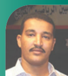
إعداد: إيهاب صالح

تطلق صحيفة «أكشن سبورت» أولى مسابقاتها الرمضانية الثقافية والدينية، في مبادرة تهدف إلى تعزيز المعرفة الدينية والثقافية، وإتاحة مساحة تفاعلية للقراء طوال الشهر الفضيل.