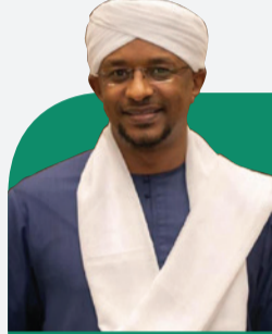
بقلم الدكتور الإعلامي: محمد عثمان

في أحد الأيام قال لي الشيخ: "ليه ما تتضم معنا لهيئة علماء السودان؟" ثم قال: "خلاص نمشي أنا وأنت يوم السبت الهيئة، وأنا بكلم رئيس هيئة علماء السودان البروفيسور محمد عثمان صالح عشان تكون معنا." وبالفعل ذهبنا، ودخل الشيخ على رئيس الهيئة وتحدث معه عن ضرورة انضمامي للهيئة، وتحدث عني بما يفوق ما أستحقه، فرحب رئيس الهيئة بمقترح الشيخ، وأثنى على البرامج التي نقدمها معاً، ثم أعطاني نموذجاً ملأته، وبعد ذلك تمت الموافقة على انضمامي إلى هيئة علماء السودان.