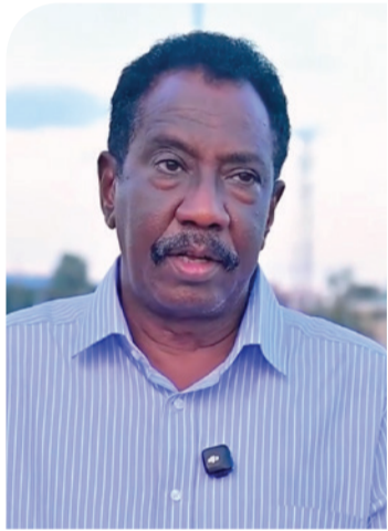
الدار البيضاء - أكشن سبورت