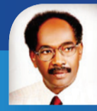
حوار: الفاضل هوارى آكشن سبورت