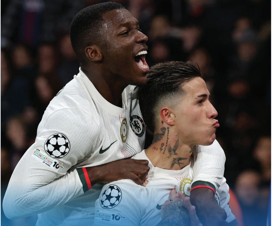
متابعات - أكشن سبورت

الفريقين 1-1 في الذهاب. ويسعى «الغانرز» إلى استغلال عاملي الأرض والجمهور لمواصله مشوارهم الأوروبي، بينما يطمح الفريق الألماني لقب التوقعات، مستنداً إلى انضباطه التكتيكي وقدرته على التحول السريع في الهجوم.