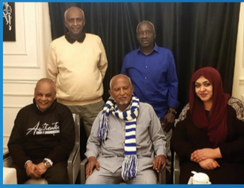
السوداني الراحل عثمان الدير

وعبرت ابنة الراحل، هديل علي قاقارين، إنابةً عن أفراد الأسرة، عن تقديرهم لهذه الزيارة التي تعكس عمق العلاقات بين أبناء النادي. ويعد الراحل علي قاقارين أحد أبرز نجوم الكرة السودانية، حيث شكّل ثنائياً مميّزاً مع عدد من نجوم جيله، من بينهم كسلا والدحيش، وترك بصمة خالدة في الملاعب خلال سبعينيات القرن الماضي، ما تزال الجماهير تتذكرها حتى اليوم.