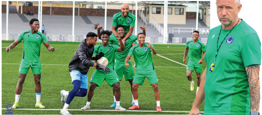
التي لم يتبق منها سوى تسع جولات.