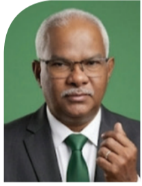
متابعات - أكشن سبورت

أعلنت عدد من وكالات الشحن البحري بين مدينتي جدة وبورتسودان عن إدخال تعديلات جزئية على أسعار شحن الشاحنات، على خلفية الارتفاع المتسارع في أسعار الوقود عالمياً، إلى جانب النقص في الإمدادات نتيجة الاضطرابات الجيوسياسية التي تشهدها المنطقة.