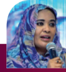
جواهر الشريف . أكشن سبورت

دشن سعادة السفير كمال علي عثمان طه، القنصل العام بسفارة السودان بجدة، انطلاقاً امتحانات الشهادة الثانوية المؤجلة للعام 2025م، أمس الاثنين، بمركز القنصلية العامة لجمهورية السودان بجدة داخل مباني جامعة جدة بحي الفيصلية، وسط ترتيبات تنظيمية محكمة وإشراف مباشر من الجهات المختصة. وقرع سعادته جرس البداية في تمام الساعة الثالثة عصراً بتوقيت مكة المكرمة إيداً بانطلاق الجلسة الأولى، بحضور رؤساء اللجان الفرعية والملحقين، قبل أن يجري جولة تفقدية على عدد من قاعات الامتحان بمركزي البنين والبنات، متمنياً للطلاب والطالبات التوفيق والسداد. وشهد مركز الامتحانات بجدة هذا العام أعداداً قياسية، إذ بلغ عدد الجالسين 3,890 طالباً وطالبة من السودانيين والأجانب، ويُعزى ذلك إلى توافد أعداد مقدره من الأسر والطلاب إلى المملكة العربية السعودية بصورة عامة، وإلى المنطقة الغربية والجنوبية بصورة خاصة خلال الفترة الماضية.