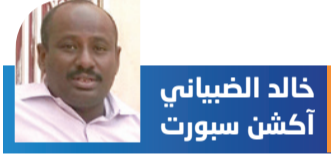
خالد الضياني أكشن سبورت

دفع الله الحاج... مسؤول بحضور الأب وفي قلب هذا المشهد، برز السفير دفع الله الحاج، الذي اختار