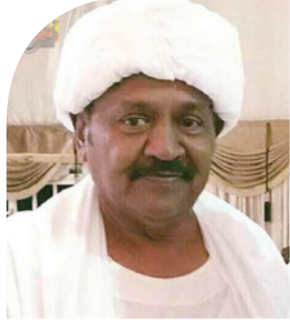
محمد علي الجاك ضقل