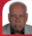
عبد المنعم هلال - أكشن سبورت

تمرّ هذه الأيام الذكرى الثالثة لرحيل أسطورة الحراسة السودانية الراحل حامد بريمة، الذي غادر دنيانا في 23 أبريل 2023، تاركاً خلفه إرثاً كروياً وإنسانياً لا يمحي.