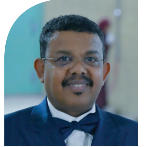
السفير محمد الباهي