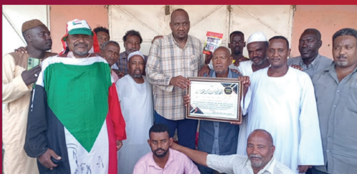
سيدو المباراة لمينارتي.