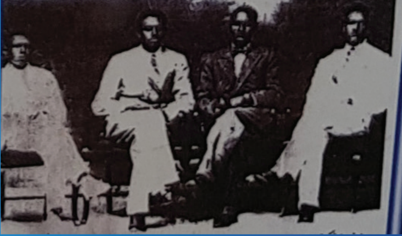
أول مجلس لإدارة نادي الهلال.