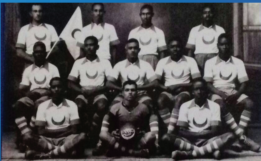
نادي الهلال 1935.