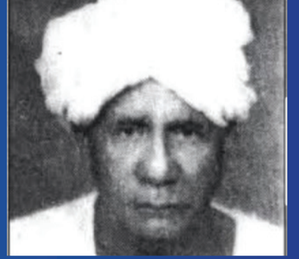
بابكر أحمد قباني، أول رئيس لنادي الهلال