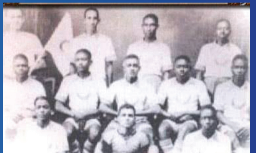
نادي الهلال 1930.