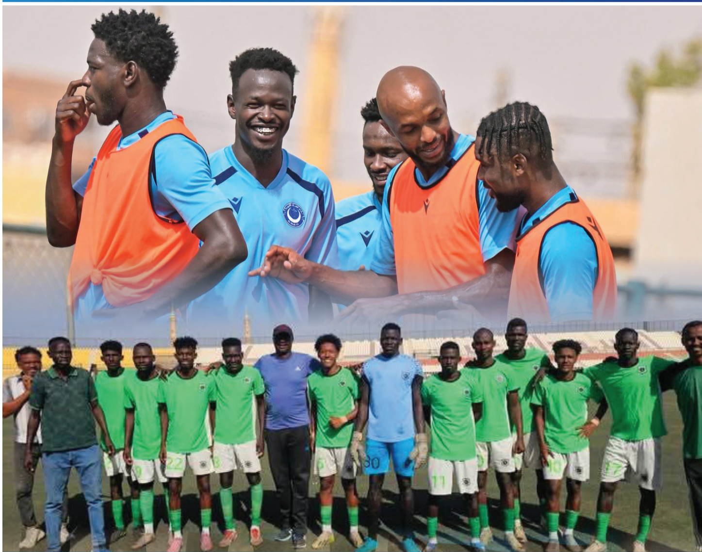
الخرطوم - أكشن سبورت

واللعب بحذر في مناطقه، حتى يتمكن على الأقل من تفادي هزيمة جديدة من شأنها أن تحقد موقف الفريق أكثر في النخبة.