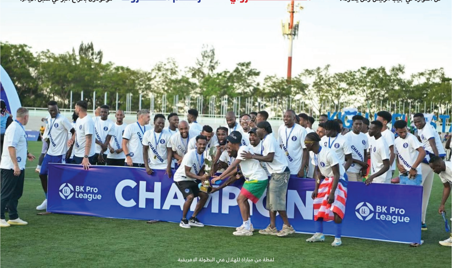
لقطة من مباراة للهلال في البطولة الإفريقية

تحدثت في مقال سابق عن «المرض الهولندي» الذي يصيب المؤسسات حين تجف الموارد وتعجز الموازنات، وهي لحظة الصدمة التي تترك أثرها السالب، خاصة في الأندية الرياضية، حيث تظل كل الموارد في جيب الرئيس ومن يعاونه،