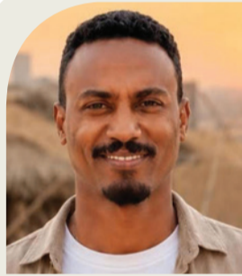
واسم محمد أحمد

في زمن تتعاضد فيه أهمية الدبلوماسية الحكيمة، وتزداد فيه الحاجة إلى القيادات التي تجمع بين الحزم والرؤية والعمل المؤسسي الراقى، يبرز اسم سعادة السفير دفع الله الحاج سفير جمهورية السودان لدى المملكة العربية السعودية، بوصفه أحد النماذج الدبلوماسية التي استطاعت أن تعيد للسفارة حضورها وهيبته ومكانتها المرموقة. لقد أسهم سعاده بصورة واضحة في تعزيز العلاقات الثنائية بين السودان والمملكة العربية السعودية، عبر نهج قائم على الاحترام المتبادل، والتنسيق المستمر، والعمل الدبلوماسي الهادئ الذي يضع مصالح الوطن والمواطن في مقدمة الأولويات. كما ظل حريصاً على ترسيخ جسور التعاون المشترك بين البلدين الشقيقين في مختلف المجالات، بما يعكس عمق الروابط التاريخية والأخوية بين الشعبين. ومنذ توليه مهامه، شهدت السفارة السودانية بالرياض حالة من الانضباط المؤسسي والتطوير الإداري الملحوظ، حيث عمل سعاده على فرض هبة المؤسسة الدبلوماسية، وترسيخ قيم الجدية والالتزام، ومحاربة مظاهر التراخي وعدم تجويد العمل، إيماناً منه بأن العمل الدبلوماسي رسالة وطنية تتطلب الكفاءة والانضباط والاحترافية العالية. كما قاد جهوداً ملموسة نحو تطوير الأداء داخل السفارة، ورفع